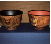
けやき漆器夫婦汁椀