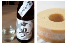
地酒「中早」・林檎ワイン バウムクーヘンみのり